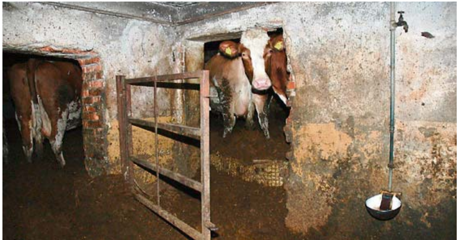
Studen BE: Katastrophale Zustände – Kühe wurden im verdreckten Stall gehalten, eine musste eingeschläfert werden