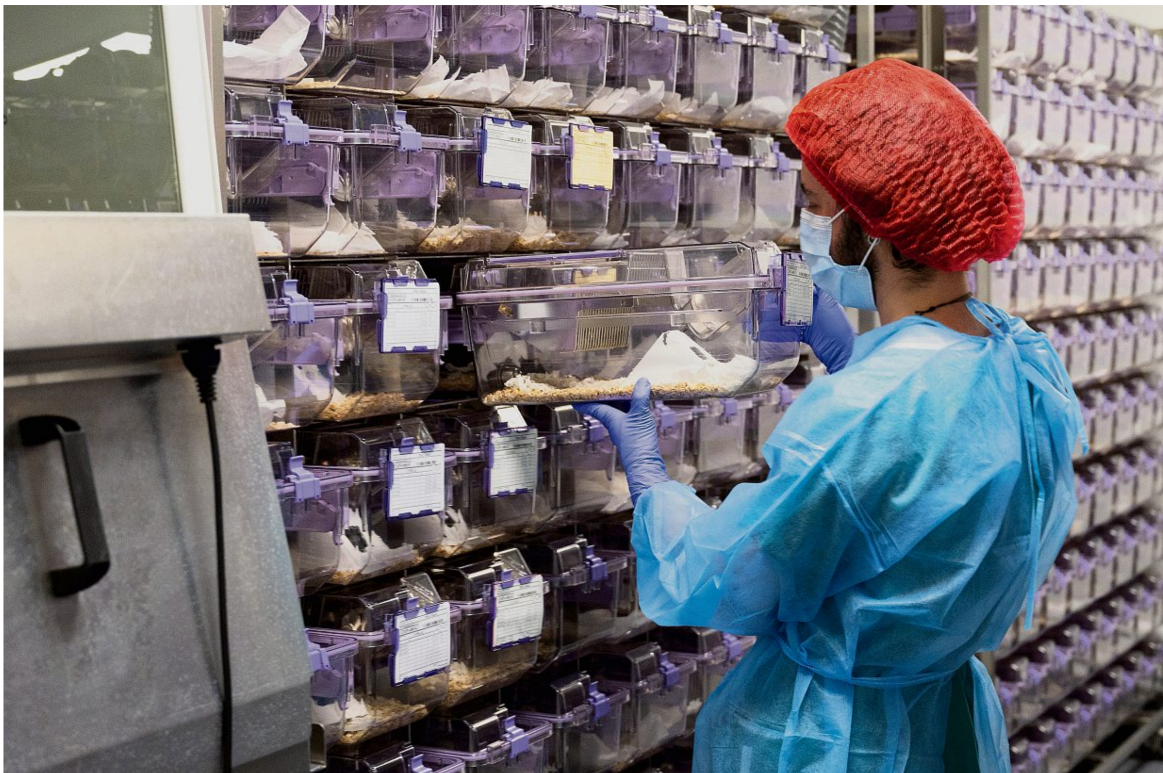
Die Käfige für Labornager sind steril und standardisiert, so wie hier in einer Tierversuchshaltung in der Westschweiz.

Humanere Tötungsmethoden gibt es schon heute, zum Beispiel