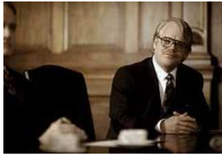
Mitreden: Philip Seymour Hoffman in «Owning Mahowny».