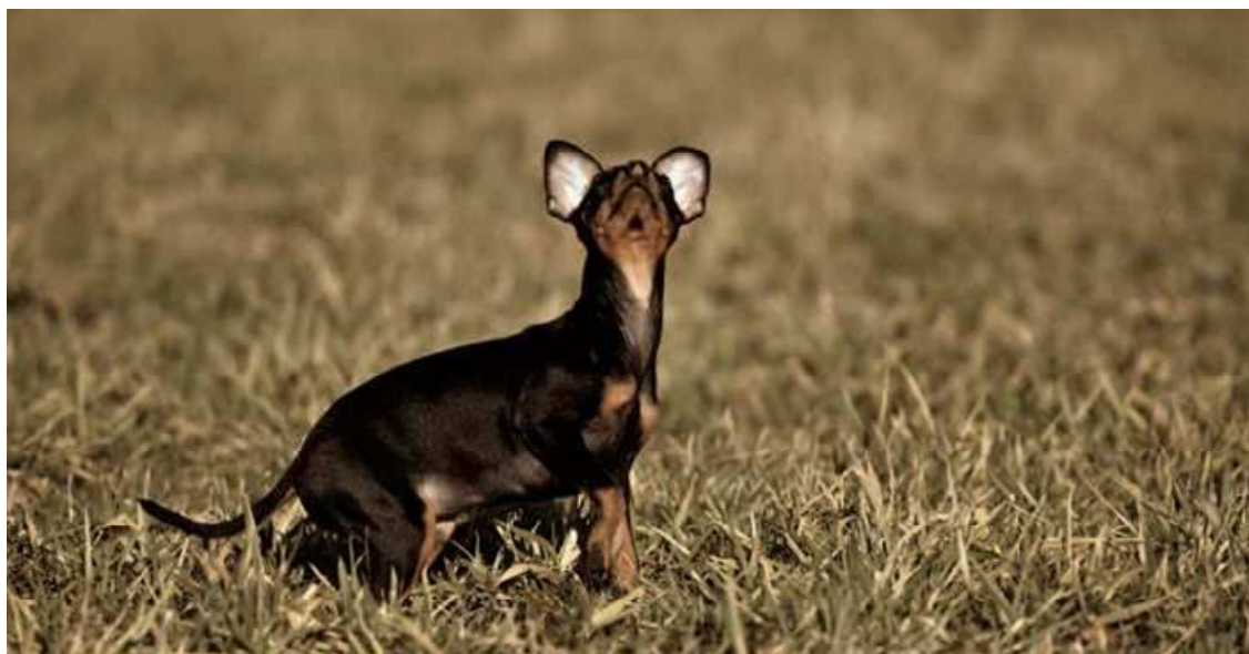
Ein solch zierlicher Hund wurde Opfer der Misshandlungen: Zwergpinscher-Welpen beim Spielen.

Ausgezeichnet Koch Fabian Spiquel begeistert die Tester von «Gault Millau». 14