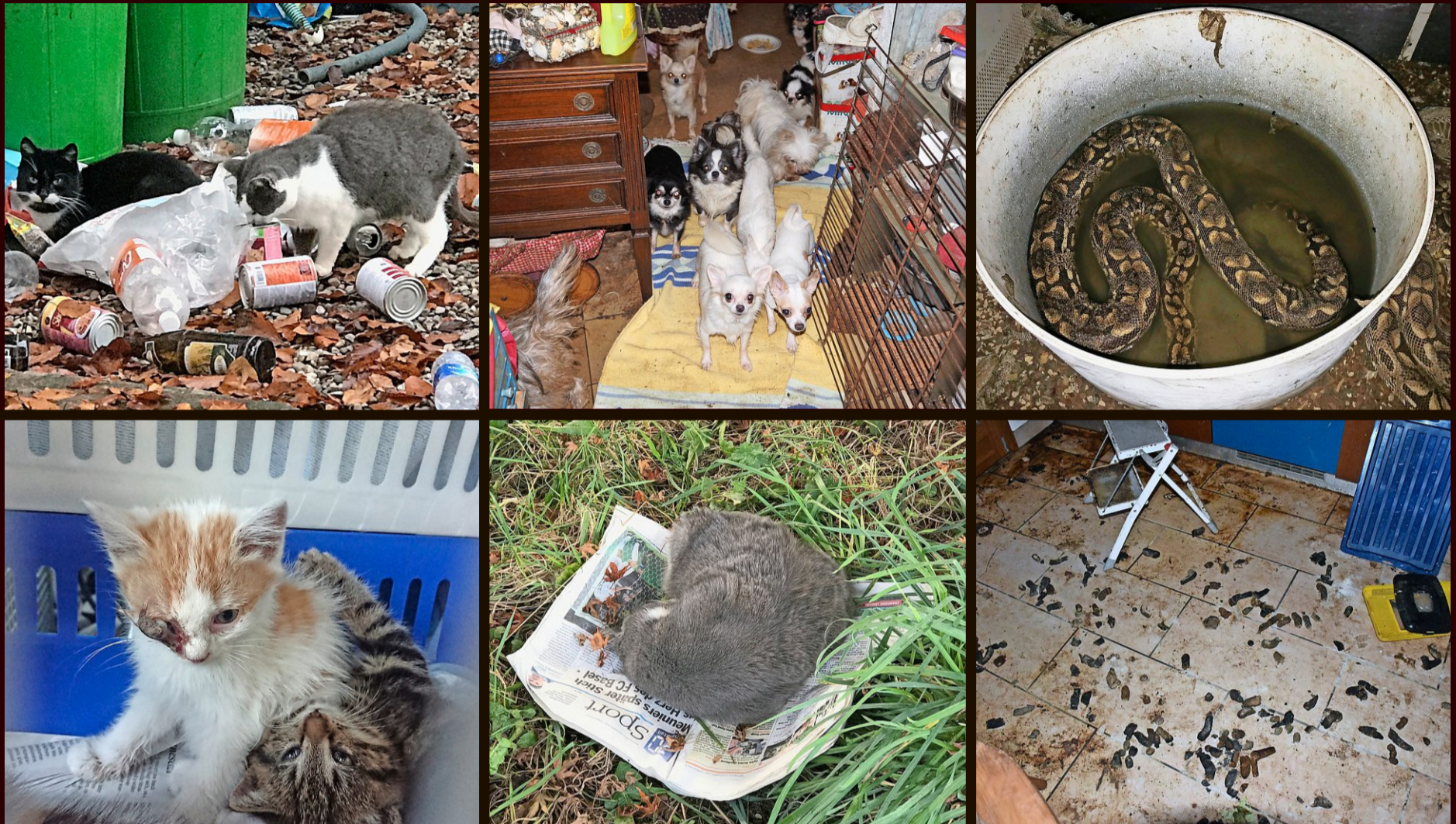
Das Grauen, auf das Tierschützer und Kontrolleure stossen: Verwahrloste, halb verhungerte oder verletzte Haustiere – oft in Messie-Haushalten

Tausende Katzen, Hunde oder Schlangen werden jedes Jahr Opfer ihrer oft überforderten Besitzer. Wenn die Behörden einschreiten, sind die Tiere oft schon tot