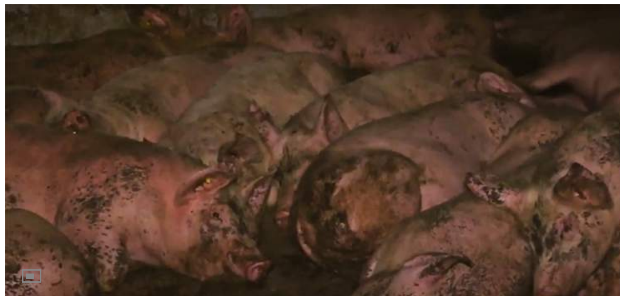
Die Schweine leben auf engstem Raum in ihrem eigenen Dreck.

Tierschutzaktivisten haben in insgesamt elf Schweinemast-Betrieben in der Deutschschweiz heimlich Videoaufnahmen gemacht. Die Bilder zeigen teilweise erbärmliche Zustände. Sie wurden mehreren Tierschutzorganisationen zugespielt, unter anderem der Zürcher Stiftung für das Tier im Recht, oder der Organisation Tier im Fokus.