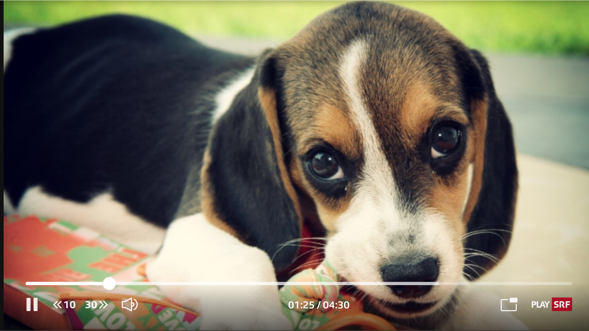
Eine Fachstelle für Tierschutz brauche es in Basel nicht, finden die Behörden. Aus Regionaljournal Basel Baselland vom 18.11.2019.