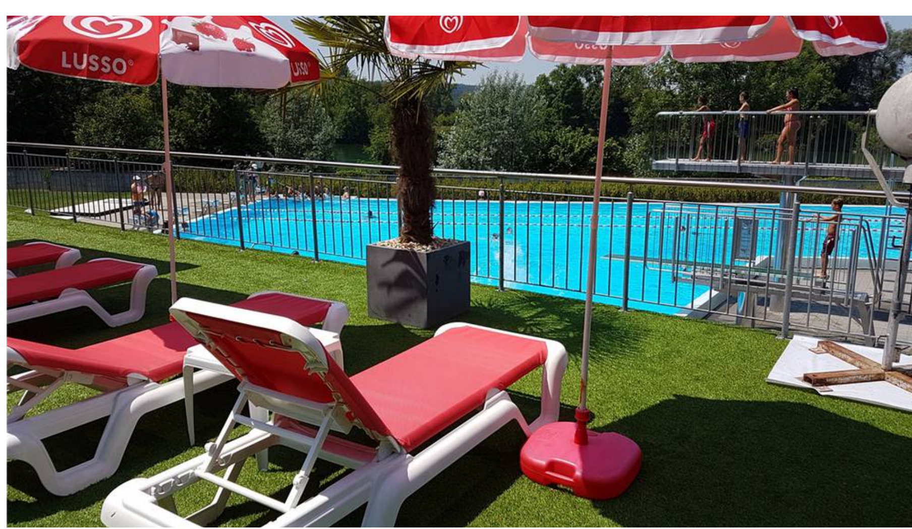
Zum Schutz der Gäste wurde im Freibad Döttingen ein Hornissennest mit chemischen Mitteln entfernt. Zum Ärger von Tierschützern

Gemeinde und Bademeister entfernen die Insekten, weil sie eine Umsiedelung für nicht verhältnismässig hielten. Die Stiftung «Tier im Recht» findet eine solche Handlung inakzeptabel.