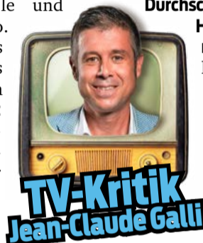
TV-Kritik Jean-Claude Galli