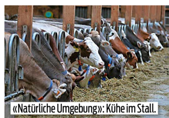
«Natürliche Umgebung»: Kühe im Stall.

wunderten sich, wieso ich nicht einfach effizient arbeiten konnte», erzählt sie mit ironischem Unterton.